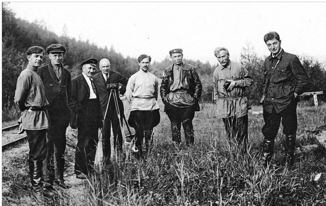
Приехав на важную государственную стройку, эти люди и не предполагали, что скоро станут врагами народа